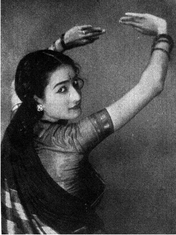
लोकनृत्य - दर्यागीत'